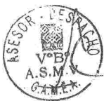
Lic. C. SOLEDAD CHAPETON TANCARA ALCALDESA MUNICIPAL GOBIERNO AUTÓNOMO MUNICIPAL DE EL ALTO

EN VIRTUD A SUS ANTECEDENTES Y A LA ATRIBUCIÓN CONFERIDA POR EL ART. 26, PUNTO TRES DE LA LEY N° 482 DE "GOBIERNOS AUTÓNOMOS MUNICIPALES", PROMULGO LA LEY MUNICIPAL N° 363 DEL 08 DE SEPTIEMBRE DE 2016 , PARA QUE SE TENGA Y SE CUMPLA COMO LEY DEL GOBIERNO AUTÓNOMO MUNICIPAL DE EL ALTO, A LOS TRECE DÍAS DEL MES DE SEPTIEMBRE DE 2016 DEL AÑO DOS MIL DIECISÉIS.